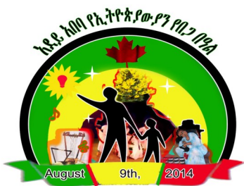
Adey Abeba Ethiopian Summer Festival IIII

The Ethiopian Community Association held its first festival event in the summer of 2010. This required many years of preparation and counted on leaders with an understanding of the interests, diversity, and trends of the community. The first step was finding stakeholders, associates, and other community leaders, recruiting volunteers as organizers turn this noble idea into a reality. The Festival is now an established annual event and to build on the legacy of the founding members a standing organizing committee has been