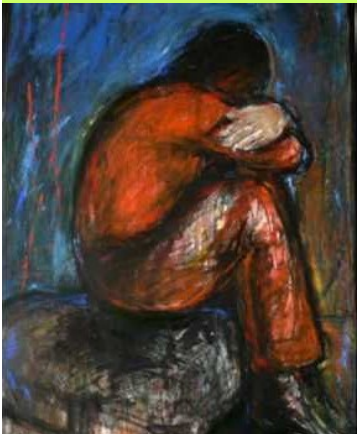
ሰው ብቻውን ይሆን ዘንድ መልካም አይደለም። እንተዋወቅ፣ እንሰባሰብ፣ እንተባበር፣ እንደራጅ፣ አብረን እንደግ።

ማህበረሰብ ኮሚቴዎች ዋና ዋና ስራዎችና ሀላፊነቶች ናቸው። የማህበራዊ አገልግሎት ሰጪ ኮሚቴ ለህብረተሰቡ መሰረታዊ አገልግሎቶችን ይሰጣል። በሞት በልደት በህመምና በችግር ወቅት በመድረስ ሀላፊነቱን ይወጣል። ራሳቸውን አግልለው በብቸኝነት የሚኖሩ፣ የታመሙ፣ በሌላም ሌላ ችግር ችና ቀውሶች ኑሮአቸው የተፋለሰ ወንድም አህቶችን ለመርዳት የምትሹ ሁሉ በዚህ ኮሚቴ ስር እንድትሰባሰቡ እንጋብዛለን። በዚህ ረገድ ድርሻ እንዲኖርዎ ከፈቀዱ በስልክ ማብራሪያ በመጠየቅ ሁሉን ነገር መረዳት ይቻላል።