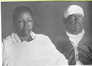
Taitu and Menelik

Enemies have now come upon us to ruin our country ... Our enemies have begun the affair by advancing and digging into the country like moles. With the help of God I will not deliver my country to them.