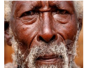
ውብ የእድሜ ባለጸጋ

የመናፈሻ ስፍራ መዝናኛ ተግባራትን ለሚሹ ሁሉ ቢያንስ በአመት ሁለት ጊዜ በማህበረሰቡ አመራር አካላት ይዘጋጃል። በጎ ፍቃደኞች በዚህም በኩል እንዲሳተፉ በሩ ክፍት ሆኖ ይጠብቃቸዋል። እድሜአቸው ከሰማንያ አመት በላይ የሆኑ ዜጎቻችንን ማወቅ እንፈልጋለን። ይህን መሰል ልዩ የልደት ቀንንም ለማክበር ልዩ ዝግጅቶችን እናደርጋለን። አባከዎ እዚህ ብልጹግ የእድሜ እርከን ላይ የደረሳችሁ ሁሉ የምስራቹን ለኮሚዩኒቲያችን ያስታውቁ ልደትዎን በጋራ እናከብረዋለንና። እድሜአቸው ከሰልሳ አምስት አመት በላይ የሆኑ ወገኖች ሁሉ በአረጋውያን ከብብ ስር ሊሰባሰቡ ይችላሉ። ስምዎ በመዝገብ ላይ ሰፍሮ ይቀመጣል። ስለ ጉዳዩ ማብራሪያ ለማግኘትም ሆነ የበጎ ፍቃድ አገልግሎት ለመስጠት ከፈለጉ ስልክዎን አንስተው ይደውሉ።